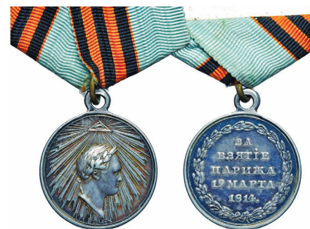
Медаль «За взятие Парижа» (1814 г.)

и унтер-офицерам. Наиболее известны следующие медали: за сражения при Калише (1706г.), Лесной (1708 г.), за отличия в Полтавской битве (1709 г.), Гангутском морском сражении (1714 г.), при Кунерсдорфе (1759 г.), Чесме (1770 г.), Кагуле (1770 г.), Кинбурне (1787 г.), Очакове (1788 г.), за штурм Измаила (1790 г.), за поход на Анапу (1790 г.), участникам Роченсальмского морского сражения (1789 г.), боя в устье р. Кюмене (1789 г.), за участие в русско-турецких войнах 1768-1774 гг. Отечественная война 1812 г. была отмечена в России общей наградой – медалью «1812 год», которую в серебре получили участники боёв, а в бронзе – лица, не участвовавшие непосредственно в боях; участники заграничного похода 1814 г. награждены серебряной медалью «За взятие Парижа». В последующем были также учреждены медали для награждения участников Русско-иранской 1826-1828 гг., Русско-турецкой 1828-1829 гг. и 1877-1878 гг., Крымской 1853-1856 гг. и Русско-японской 1904-1905 гг. войн. Для награждения участников отдельных сражений в этих войнах, например, героической обороны Севастополя в 1854-1855 гг. и беспримерного боя «Варяга» и «Корейца» против японской эскадры в 1904 г. были отчеканены особые медали. В 19 веке исключительно для «нижних чинов» были учреждены медали «За храбрость» и «За усердие».