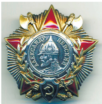
Орден Александра Невского

Ордена СССР – государственные награды за особые заслуги в коммунистическом строительстве, защите социалистического