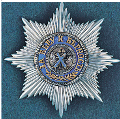
Орден Андрея Первозванного (1689 г.)

Ордены России как почётные государственные награды вручались за воинские и другие отличия и заслуги. В России были учреждены следующие ордена: Андрея Первозванного (1698 г.) – высшая награда Российской империи; Екатерины 1-й и 2-й степени (1714 г.); Александра Невского (1725 г.); Анны (1735 г., с 1797 г.) имел 3 степени, с 1815 г. – 4 степени); Георгия 1, 2, 3, 4 степени (1769 г.); в 1807 г. учреждён знак отличия этого военного ордена для награждения за доблесть в боях рядовых и унтер-офицеров, с 1856 г. 4 степени: 1-ая и 2-ая – золотые, 3-я и 4-я – серебряные кресты, которые с 1913 г. стали называться Георгиевскими крестами; Владимира 1, 2, 3 и 4 степени (1831 г., с 1839 г. – 3 степени); Иоанна Иерусалимского (Мальтийский орден) (1798 г.); Ольги 1,2 и 3 степени (1913 г.); Каждый орден имел свой статут и соответствующую орденскую ленту. Особыми знаками отличия, близкими к орденам России, являлись золотые кресты, которыми награждались в конце 18 – начале 19 веков офицеры – участники взятия Очакова (1788г.), Измаила (1790 г.); Базарджика (1810г.), сражения при Прейсиш-Элау (1807 г.), но не награждённые орденами. Эти награды носились на ленте ордена Георгия.